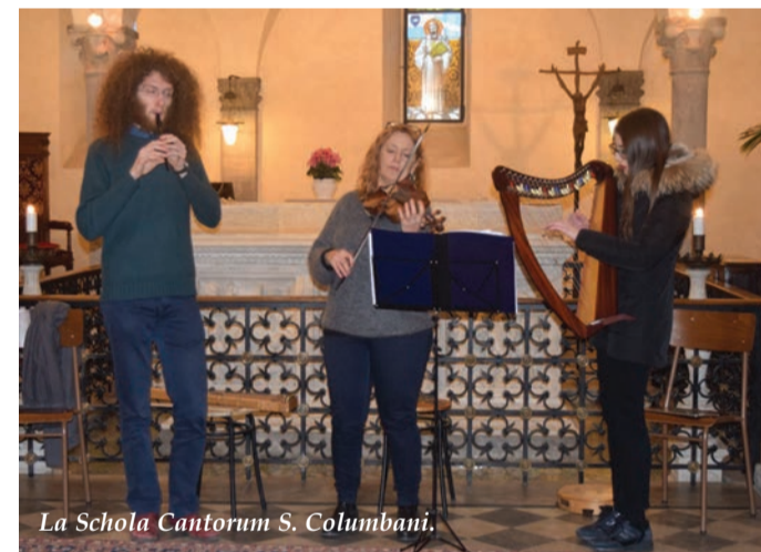
La Schola Cantorum S. Columbani.