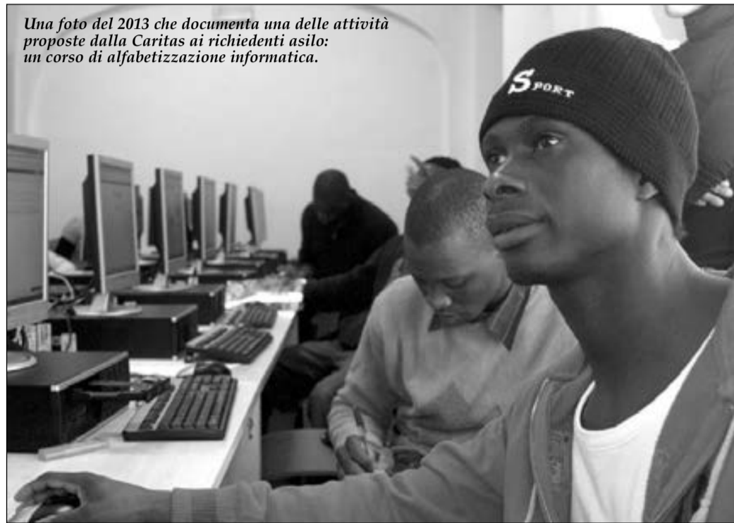
Una foto del 2013 che documenta una delle attività proposte dalla Caritas ai richiedenti asilo: un corso di alfabetizzazione informatica.

L'Anci, l'Associazione Nazionale Comuni Italiani, ha de-