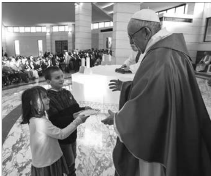
Sacrofano, 15 febbraio: papa Francesco celebra la messa per i partecipanti al Meeting "Liberi dalla paura".

La parola che manca. C'è un'assenza impressionante nel testo del "Padre nostro". Se io domandassi a voi qual è l'assenza impressionante nel testo del "Padre nostro"? Non sarà facile rispondere. Manca una parola. Pensate tutti: che cosa manca nel "Padre nostro"? Pensate, che cosa manca? Una parola. Una parola che ai nostri tempi - ma forse sempre - tutti tengono in grande considerazione. Qual è la parola che manca nel "Padre nostro" che preghiamo tutti i giorni? Per risparmiare tempo la dirò io: manca la parola "io". Mai si dice "io". Gesù insegna a pregare avendo sulle labbra anzitutto il "Tu", perché la preghiera cristiana è dialogo: "sia santificato il tuo nome, venga il tuo regno, sia fatta la tua volontà". Non il mio nome, il mio regno, la mia volontà. Io no, non va. E poi passa al "noi". Tutta la seconda parte del "Padre nostro" è declinata alla prima persona plurale: "dacci il nostro pane quotidiano, rimetti a noi i nostri debiti, non abbandonarci alla tentazione, liberaci dal male". Perfino le domande più elementari dell'uomo - come quella di avere del cibo per spegnere la fame - sono tutte al plu-