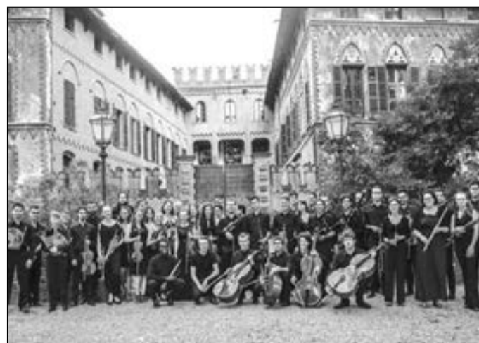
I componenti della Monferrato Classic Orchestra. Sabato 23, diretti da Joonas Pitkänen, saranno in concerto alla Galleria Alberoni.

Si tratta di un importantissimo solista e virtuoso che accompagnerà in alcuni concerti, compresa la tappa piacentina, la Monferrato Classic Orchestra, suonando un violino Storioni del 1774, concessogli dalla Repubblica Federale tedesca.