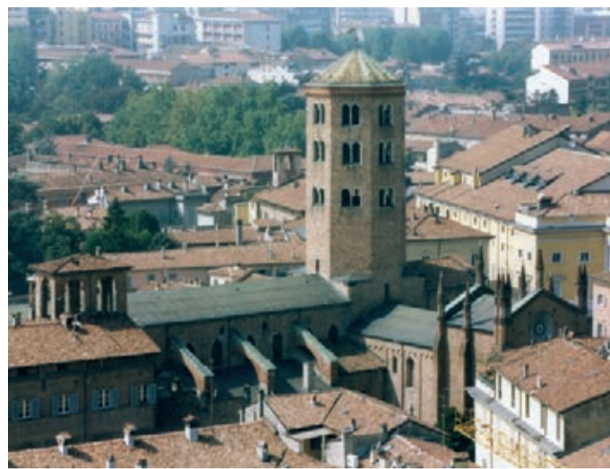
Nelle foto: sopra, panoramica su Piacenza con al centro la torre campanaria di Sant'Antonino; a lato, l'intervento del vescovo mons. Ambrosio al convegno sul turismo; sotto, il ponte Gobbo a Bobbio.

riempiono il cuore - ha aggiunto -. Piacenza ha capito che bisogna fare sistema, e i