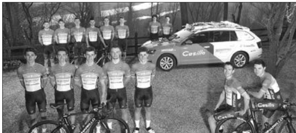
Il team Casillo-Maserati alla presentazione al Castello di Rivalta.