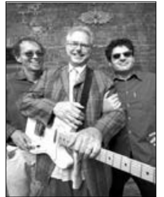
Il trio Bill Frisell protagonista allo Spazio Rotative domènica 24 febbraio.