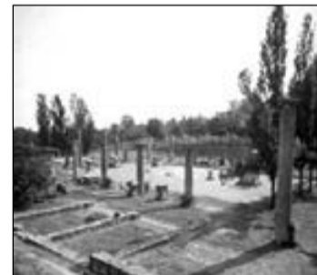
Veleia, una delle località bagnate dal torrente Chero.

Il toponimo sarebbe attestato nella forma fluvio Cario all'inizio del IX sec. d.C., successivamente come flumen Cheri oppure Cherium . La sua origine è probabilmente latina dalla voce charius , escludendo invece la derivazione dal nome della divinità Giove Cario. Non pare essere peregrina tuttavia l'ulteriore ipotesi di una derivazione dal nome proprio celtico karro , infatti non è da dimenticare che gli idronimi, tra tutti i toponimi, sono quelli che conservano le origini più antiche.