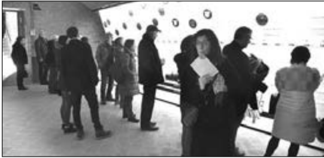
Visitatori alla mostra evento su “Annibale”.

Venerdì 22 presso lo Spazio Mostre del Farnese