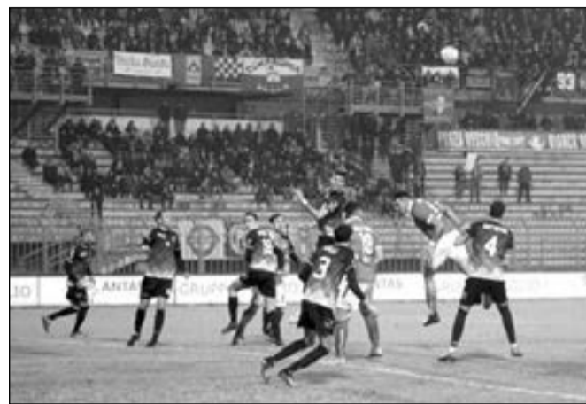
Piacenza-Pro Piacenza, i biancorossi colgono la seconda vittoria consecutiva (1-0).

F inalmente il Giudice Sportivo ha messo fine all'agonia del Pro Piacenza con l'esclusione definitiva dal campionato. Sull'incredibile episodio che ha visto la formazione (?) del Pro Piacenza scendere in campo a Cuneo con 7 improvvisati ragazzini con l'aggiunta di un altrettanto improvvisato massaggiatore si sono già spesi fiumi di parole per cui sarebbe pleonastico tornare su questo episodio che, se non altro, ha avuto il merito di chiudere una vicenda penosa che, auguriamoci, possa portare a delle severe punizioni per i responsabili.