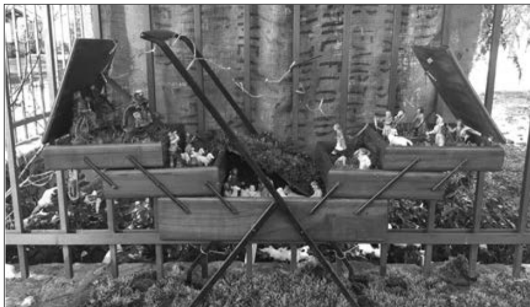
Nella foto, un presepe realizzato in una delle cascine nella campagna della Bassa Valdarda negli anni scorsi.

Con inizio alle ore 10.45 verranno premiate le redazioni dei giornali scolastici aderenti all'iniziativa promossa da Terre Traverse. Fino al 10 marzo la mostra fotografica