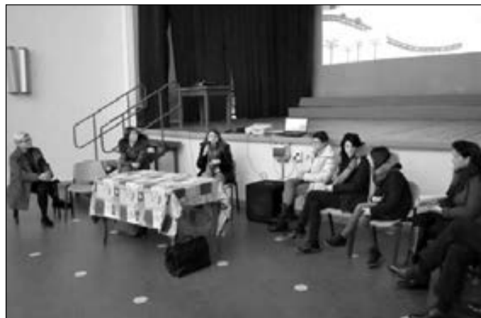
Sopra, i relatori intervenuti all'incontro dedicato ai nuovi progetti multidisciplinari.

Cucina con la società Salus, scienza, lettura sono le nuove attività svolte alla scuola Beata Vergine Addolorata. La coordinatrice Fism: "i bambini accrescono la voglia di sperimentare"