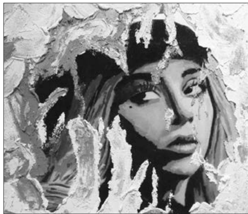
Uno dei quadri dell'artista Alessandro Masera in esposizione a Rosso Tiziano.

Il ritorno alla pittura, nel 2015, avviene nel solco di tutte le esperienze di vita e artistiche passate e con una notevole sete creativa e sperimentale. Nei suoi dipinti, come quelli che si possono ammirare in galleria, la passione per l'arte pop si realizza con l'uso di materiali oggi desueti, come l'intonaco, che gli serve per rendere l'opera la più viva possibile. Oltre a questo, Masera usa lo stucco, il gesso, il quarzo su base di legno e il glitter, per crea-