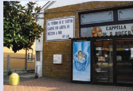
L'esterno del Centro Manfredini a Piacenza.