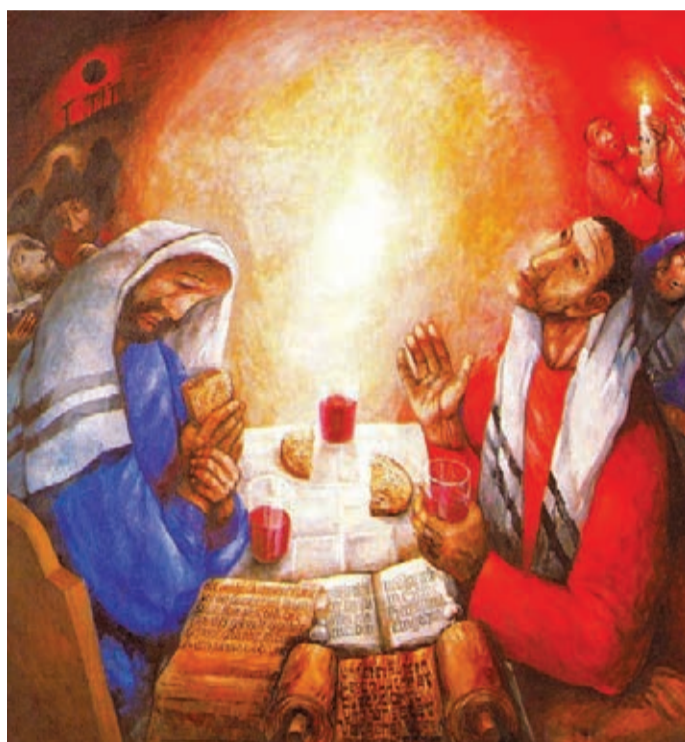
Il dipinto della Cena di Emmaus ad opera dell'artista tedesco Sieger Köder.

Il percorso diocesano è ispirato all'episodio dei discepoli di Emmaus