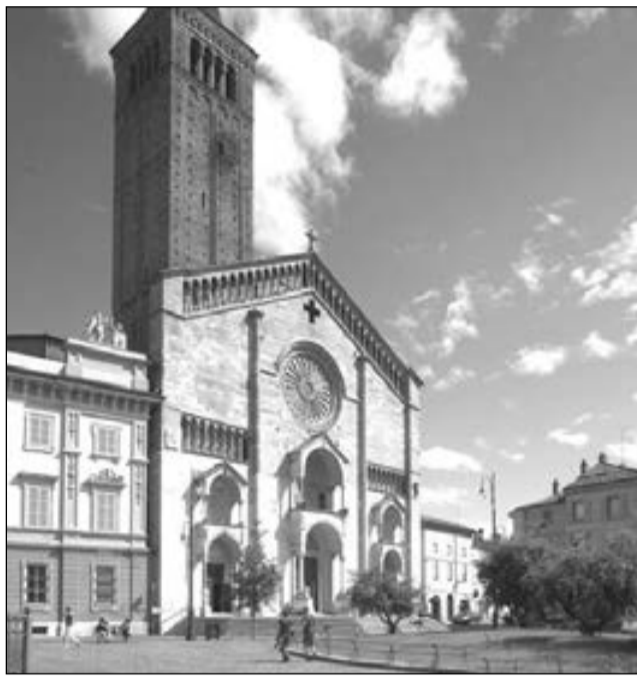
La Cattedrale di Piacenza.

Le parrocchie disponibili per il servizio dei ministranti / accolti alla messa episcopale delle ore 18.30 nelle domeniche di Quaresima (10, 17, 24 e 31 marzo, e 7 aprile) sono pregate di contattare il parroco-arciprete della Cattedrale don Serafino Coppellotti, cell. 3392661147.