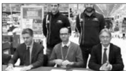
La presentazione all'Auchan di San Rocco dell'evento "Bottigelli Volleyball Match".

I tagliandi, al prezzo speciale di 5 euro, si