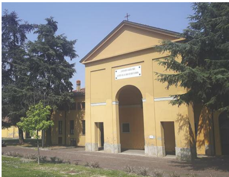
Il cimitero di Piacenza con la chiesa di Santa Maria del suffragio.