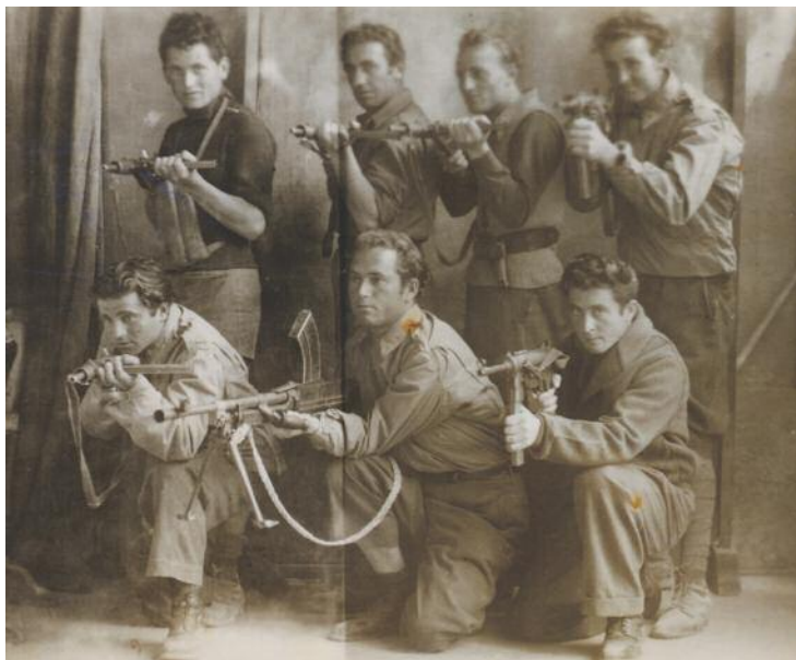
Una foto di gruppo di partigiani di Gropovisdomo, paese poco distante da Obolo.

derli dalla rivolta: “Partigiani! Le operazioni di rastrellamento a vasto raggio attualmente in corso hanno inflitto già fin d’ora sconfitte disastrose alle vostre bande. Esse hanno avuto perdite fortissime in uomini, armi e materiali... I rastrellamenti verranno continuati implacabilmente nei giorni che seguiranno, con impiego sempre maggiore di mezzi... Cosa sperate ancora? Quale ideale vi guida?... Non vi accorgete che questa lotta fratricida che avete provocato e state conducendo, altro risultato non porta che quello di aumentare i lutti e la desolazione nelle vostre stesse case?” . E, riferendosi a un bando di amnistia emesso da Mussolini, il volantino continua: “Un’ultima possibilità vi viene offerta per ritornare alla ragione ed alla via retta... Ci dichiariamo disposti a trattare ancora con la benevolenza che il bando stesso prevedeva, quanti di voi si presenteranno nei prossimi giorni ai nostri reparti... Partigiani! Riflettete finché siete in