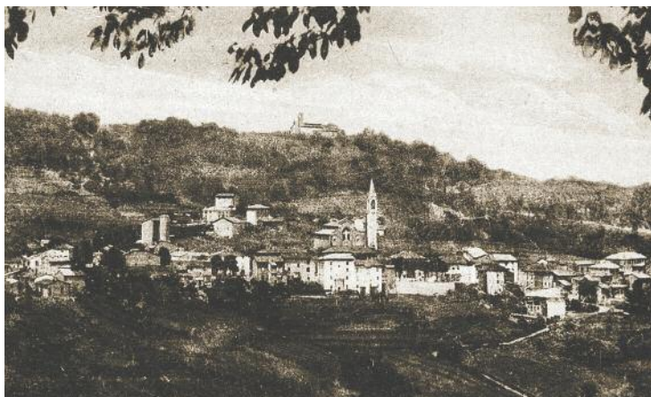
Una veduta del 1936 di Gropparello.