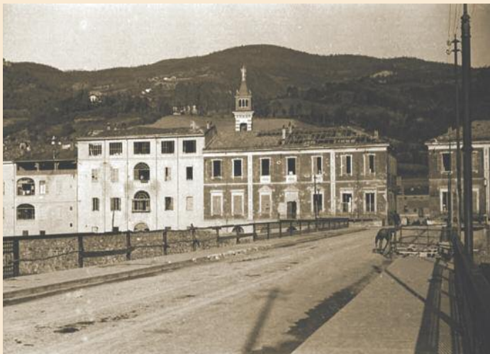
Una veduta di Bettola, sede del Comando unico.

coraggio. Fu tra i Sacerdoti più ricercati dall'Ufficio politico.