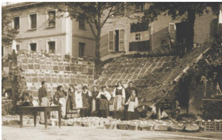
Una foto storica della Festa dell'uva a Gropparello.

in canonica ma di scappare lontano da Obolo, si aggrappa con tutte le forze alla sua lunga veste nera.