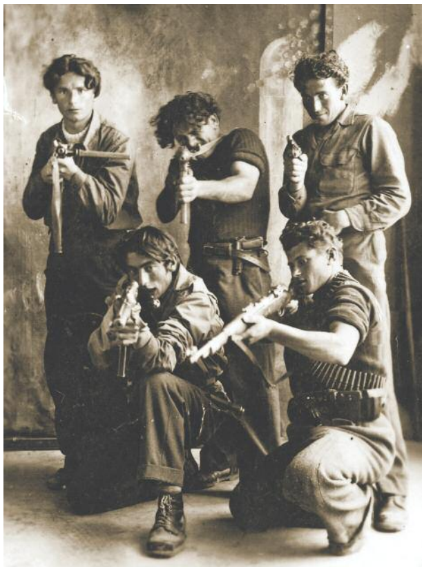
Partigiani della zona di Gropparello.

a seppellire il ragazzo nel cimitero della sua chiesa. Sfidando gli ordini.