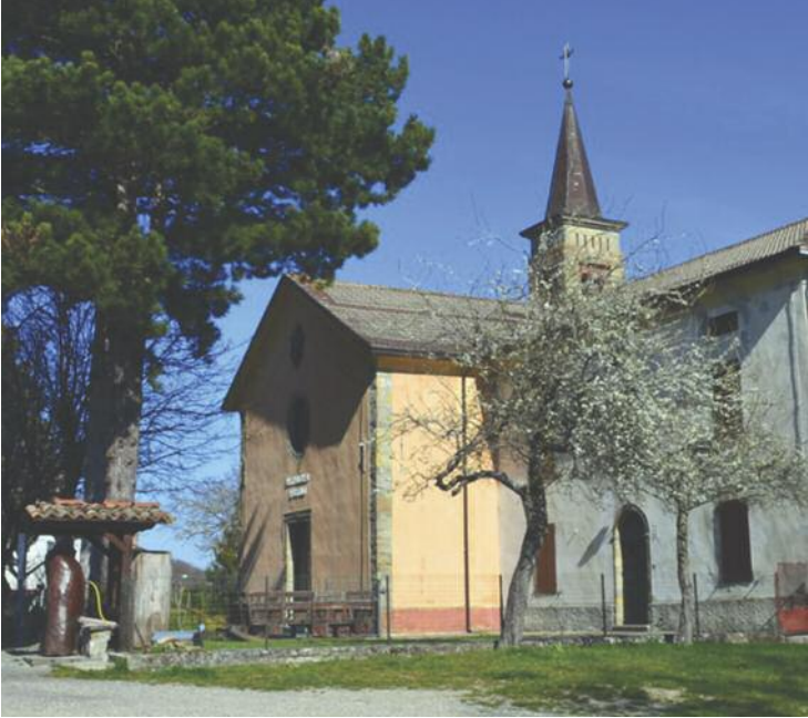
La chiesa di Obolo, dedicata a San Bartolomeo apostolo.

ta della sua canonica è sempre aperta, lui a qualsiasi ora pronto ad accogliere e dividere il pasto.