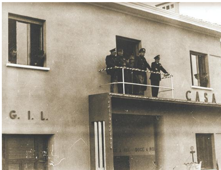
La Casa della Gioventù Italiana del Littorio a Gropparello.