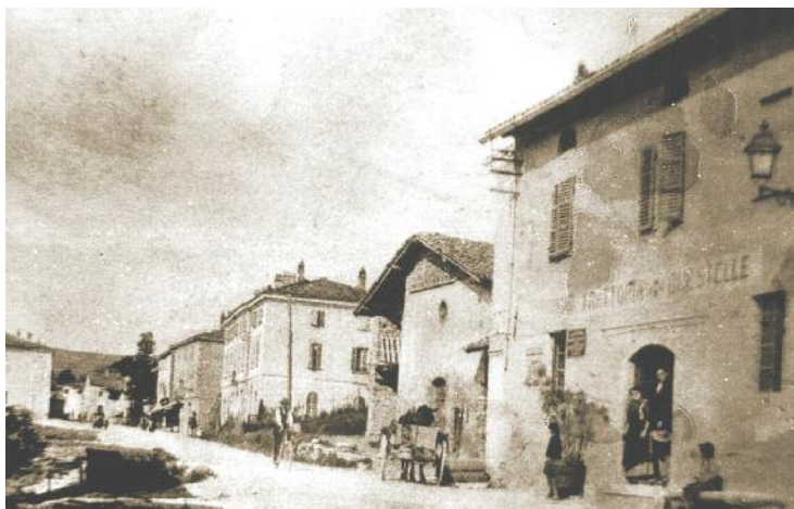
La piazza di Gropparello in un'immagine storica.

Don Borea è uno dei cinque sacerdoti della diocesi di Piacenza che, insieme a un seminarista, hanno pagato con la vita il loro servizio religioso e pastorale, il servizio di "padri" nei confronti della gente, condividendo i valori della libertà, della giustizia e della patria, e più in generale spinti da un umane-