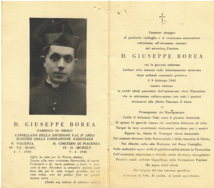
L'immagine ricordo di don Borea.

Al cappellano ha chiesto poi di dire al Vescovo e ai confratelli che non era colpevole dei reati dei quali era stato accusato e di fare di tutto per riabilitare la sua memoria.