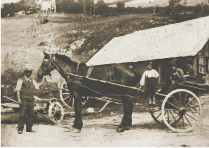
Scena di vita contadina a Gropparello.

mettendo di dare in visione all’Autorità ecclesiastica i verbali dell’istruttoria e, in un successivo incontro, dice che i testimoni della difesa verranno ascoltati.