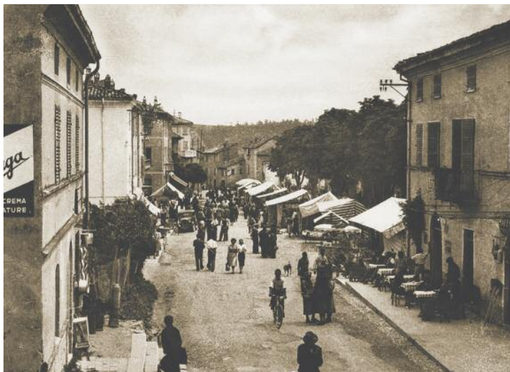
La piazza di Gropparello con il mercato in una foto d'epoca.

già consumata. L'imputato ha ascoltato, calmo, i capi di imputazione, ammettendo candidamente il suo sostegno alla Resistenza, confermando di aver indossato la divisa di cappellano dei partigiani con il distintivo del grado, su cui spiccava la croce rossa. Quando viene accusato di non aver lasciato la sua parrocchia, la sua montagna, che era diventata terra di ribelli, risponde con slancio: "Il mio posto era là! E là ero rimasto" .