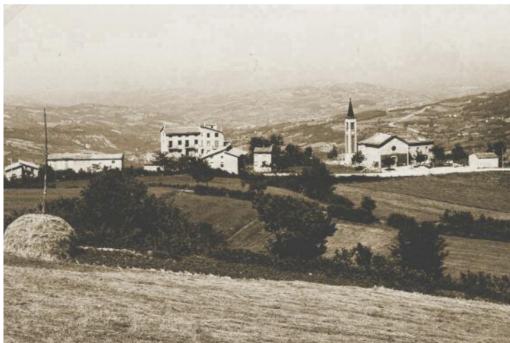
Un'immagine di Obolo negli anni Sessanta.

simo illuminato che li ha posti sopra le parti in lotta, pur aderendo pienamente alla causa della Liberazione; capaci di andare oltre le divise e di non lasciarsi abbruttire dal dramma della guerra civile.