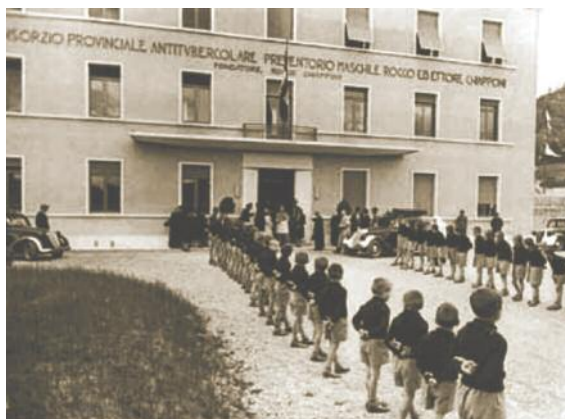
Il preventorio di Bramaiano di Bettola.

Castagnetti si muove su più fronti. Innanzitutto cerca testimoni dell’alta condotta morale di don Borea in qualità di cappellano. Per confutare l’accusa di maltrattamento nei confronti dei prigionieri fascisti, li cerca proprio tra i soldati repubblicani catturati dai partigiani e successivamente liberati. Ne trova cinque: “Trattandosi di persone colte – appunta nel diario – le loro deposizioni sono particolarmente autorevoli” . Peccato che nessuno vorrà mai ascoltarle.