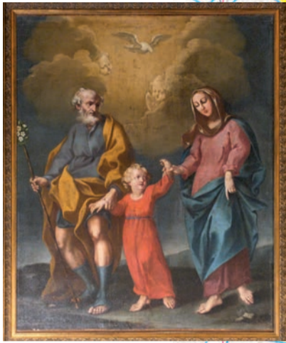
Sopra, la "Sacra Famiglia in cammino". A lato, la cartina col percorso.