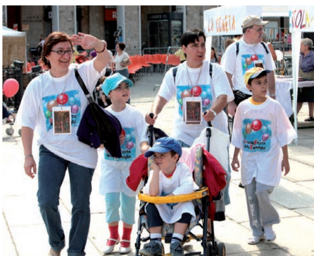
Nella foto di Cravedi, un'immagine dell'edizione 2009 della "Grande Festa della Famiglia".

ridare significato a ciò che fa, a rinnovare e dare nuova linfa ai legami, specie quelli più significativi; penso ad esempio al legame di coppia, che oggi può durare solo se le persone sono in grado di ri-generarlo nel tempo, lungo tutto il corso della vita che si prospetta «lunga».