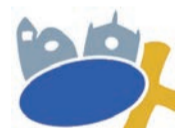
DIOCESI DI PIACENZA-BOBBIO UFFICIO CATECHISTICO