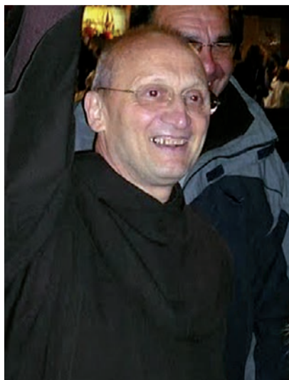
A destra, dall'alto, Luigi e Zelia Martin e un'immagine della cerimonia di beatificazione dei coniugi Martin: è stata riconosciuta la guarigione ottenuta per loro intercessione del piccolo Pietro Schilirò, nato con gravi difficoltà respiratorie (nella foto).